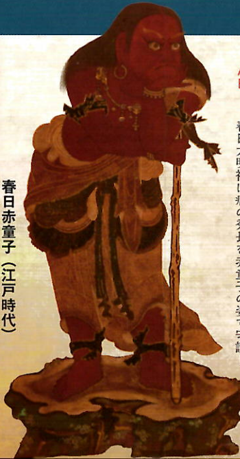
春日赤童子(江戸時代)