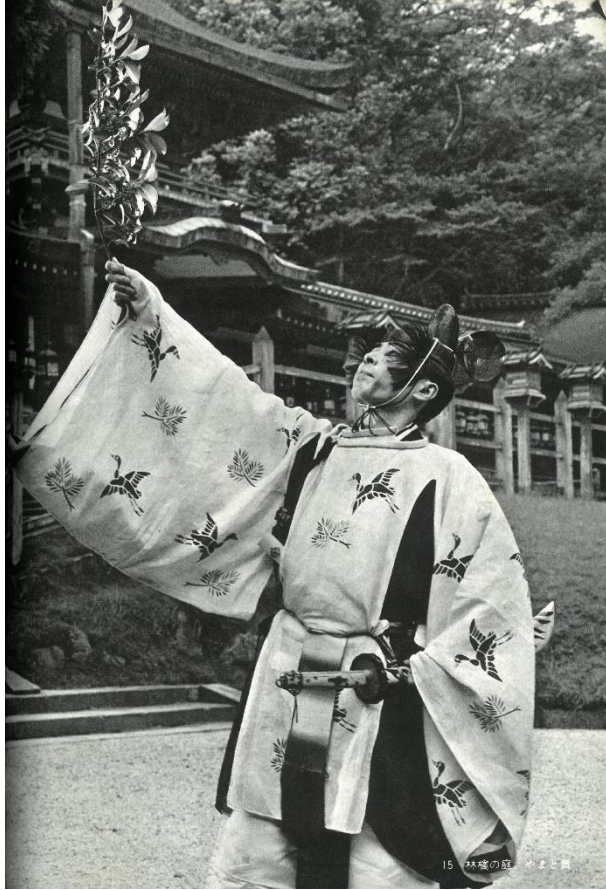
『奈良 春日野』より「林檎の庭 和舞」

日本に写真が伝来したのは、今から約180年前、幕末の頃のことです。肖像写真をはじめ、風景や風俗、文化財など、写真は世界を記録する道具として活用されてきました。その後、写真家たちは奈良を、そして春日の地を、それぞれの視点で撮影し、発表してきました。とりわけ奈良在住の写真家・入江泰吉は、戦後から約半世紀にわたり春日大社や春日野の風景を撮影してきました。