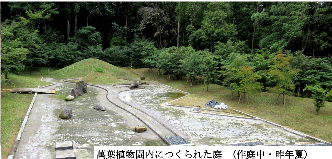
萬葉植物園内につくられた庭（作庭中・昨年夏）