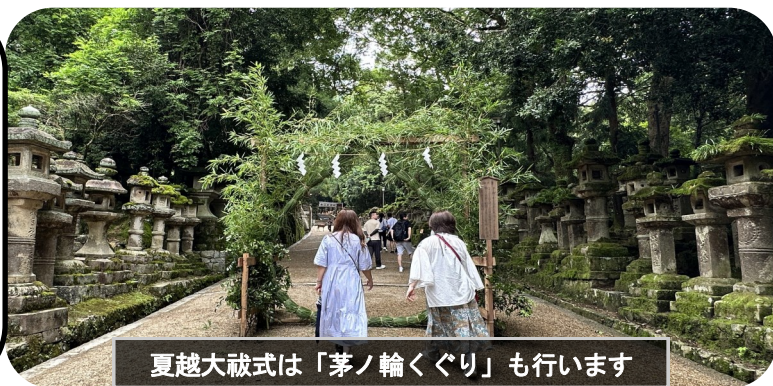
夏越大祓式は「茅ノ輪くぐり」も行います

特に毎年6月30日と12月31日には、日本国中の災い事を祓い清めるため、「大祓式」という儀式が行われている。