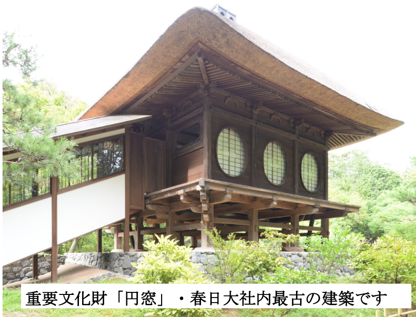
重要文化財「円窓」・春日大社内最古の建築です

永らく境内に隣接した片岡梅林に「円窓」はありましたが、保存と文化財活用のために萬葉植物園内に移築されました。五ヶ屋の歴史と建物の重要性について担当者から詳しくお話します。講演後現地建物の見学会を行います。