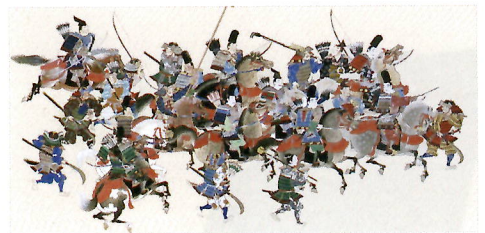
春日本・春日権現験記 第4巻