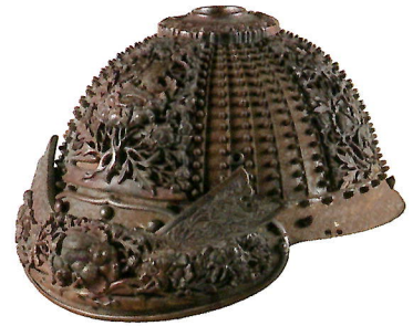
重要文化財 鉄三十六間四方白星兜鉢

国家国民の守り神として雅な印象が強い春日社には、日本神話の時代以来の武神としての一面があります。神様に奉納された刀剣や甲冑の中に垣間見られる優雅な美しさや、文書記録に込められた切実な思いを通して、武士たちの心情を感じて頂くことができる展覧会です。