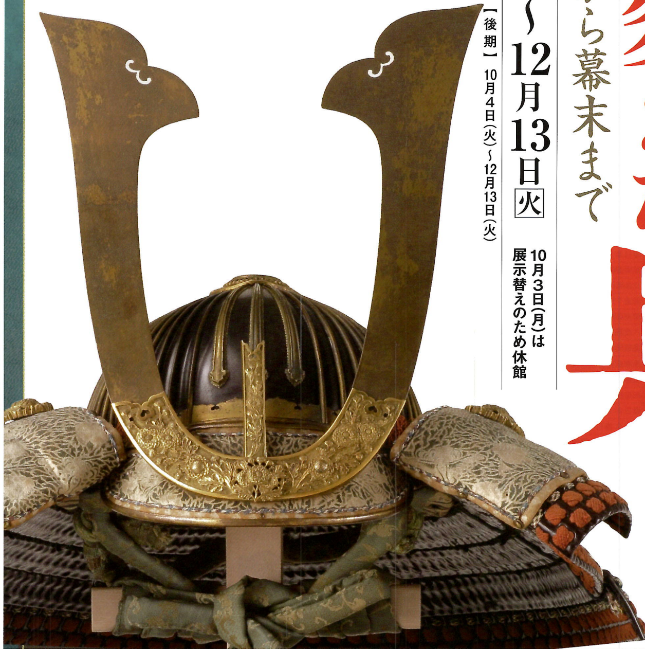
〔国宝〕 伝 楠木正成奉納 黒韋威胴丸(部分)