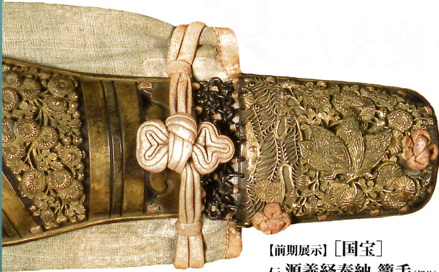
【前期展示】〔国宝〕 伝 源義経奉納 籠手(部分)