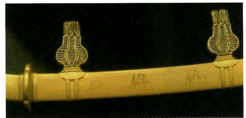
国宝 金装花押散太刀(鞘部分)