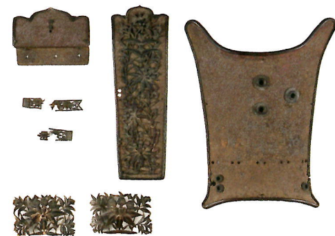
竜胆文透彫鍍金具