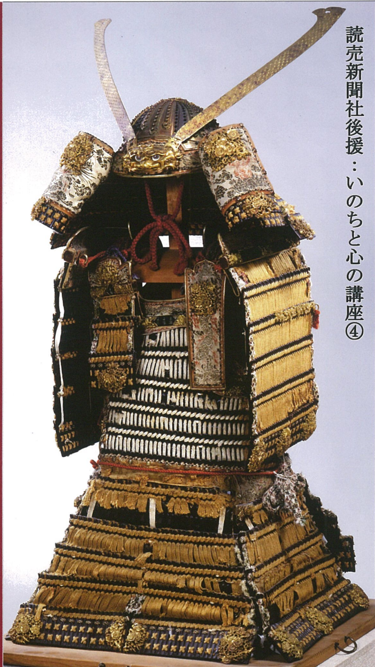
読売新聞社後援：いのちと心の講座④