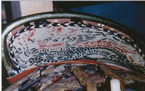
鎧の細部には竜紋も見られる