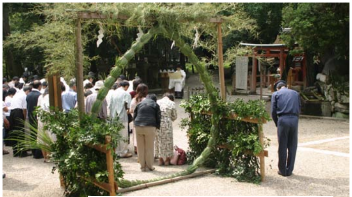
祓戸神社前に設けられた夏越の茅ノ輪