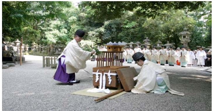
二ノ鳥居横・祓戸神社にて行われる大祓式